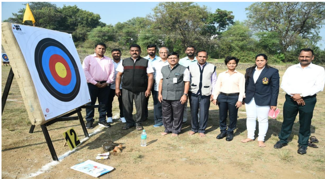
Inauguration of Archery Competition